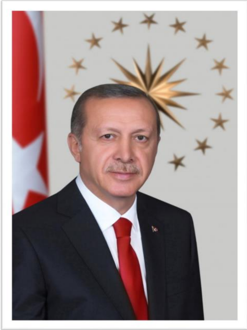
Recep Tayyip ERDOĞAN Cumhurbaşkanı