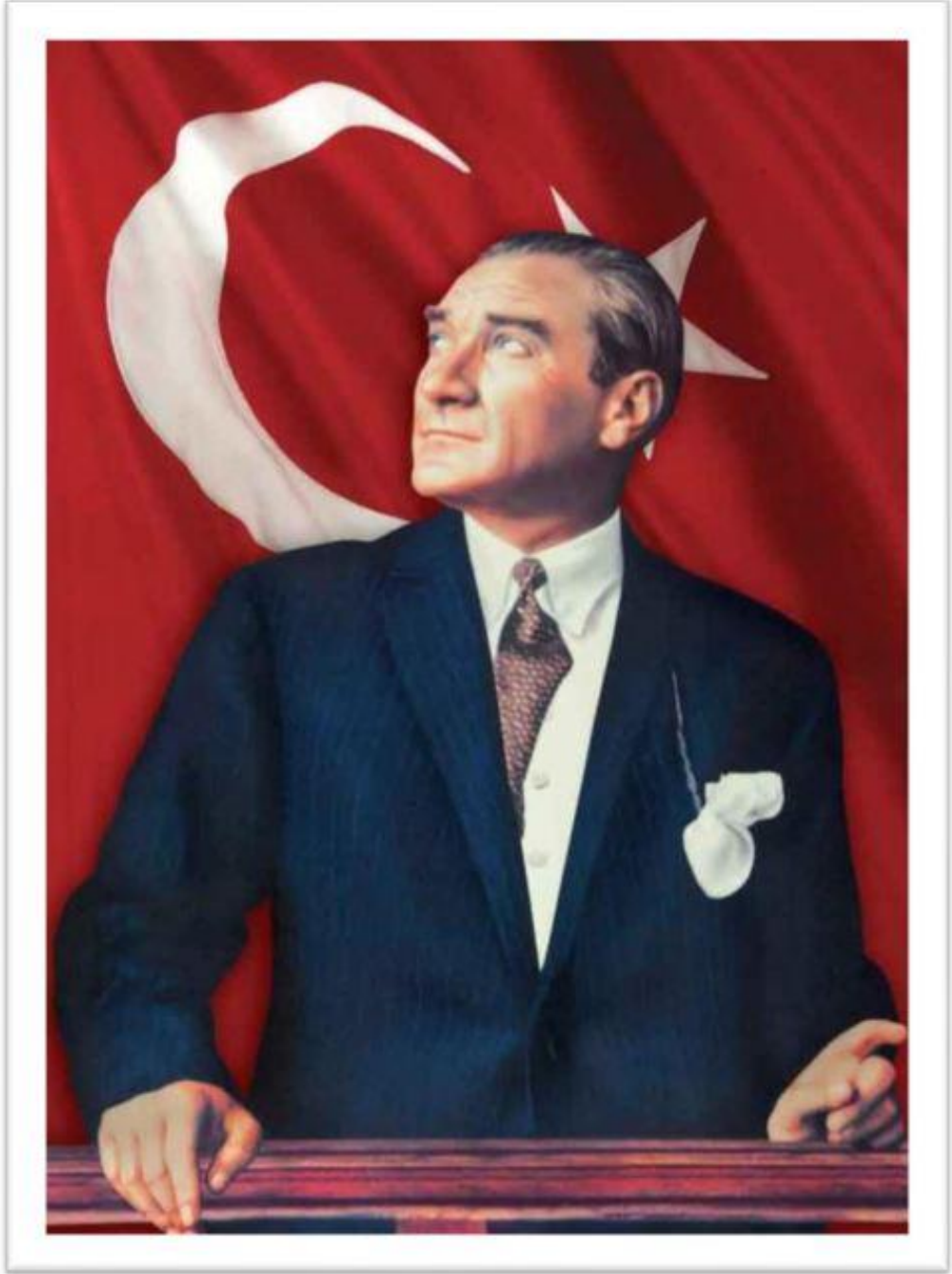
Mustafa Kemal ATATÜRK