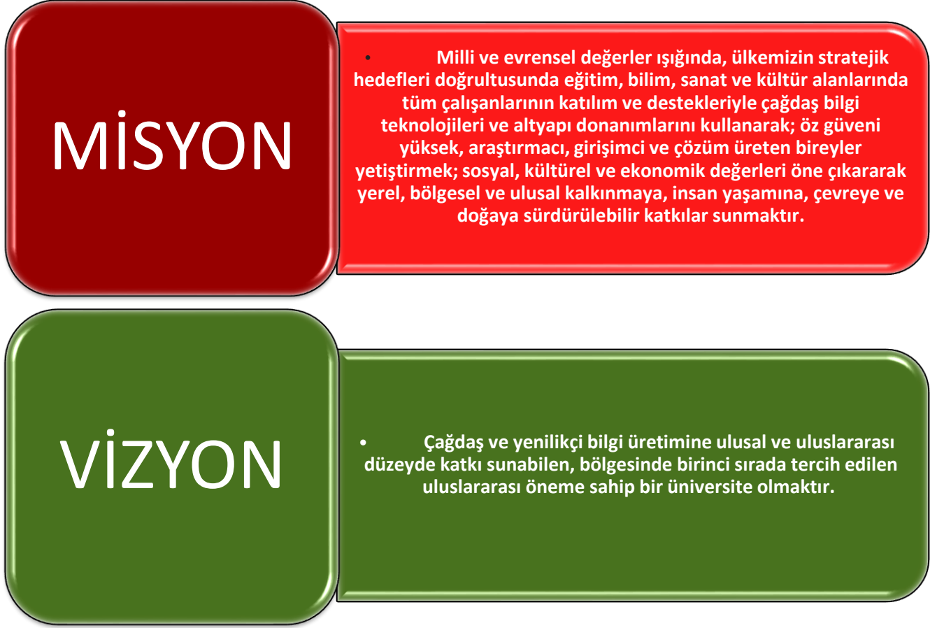
Şekil 1: Mision-Vizyon Grafiği