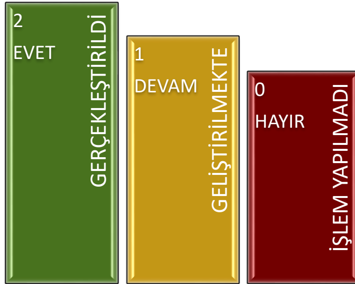
Şekil 3 : İç Kontrol Soru Formu Değerlendirme Ölçütleri

Değerlendirmede birimlerden sorumlu oldukları her bir eylemin gerçekleştirilmiş olması durumunda; Evet (2 puan), çalışmaların devam ediyor olması durumunda; Geliştirilmekte (1 puan) ve herhangi bir işlem yapılmayan durumlarda; Hayır (0 puan) seçeneklerinin işaretlenmesi suretiyle iç kontrol soru formunun cevaplandırılması istenmiştir.