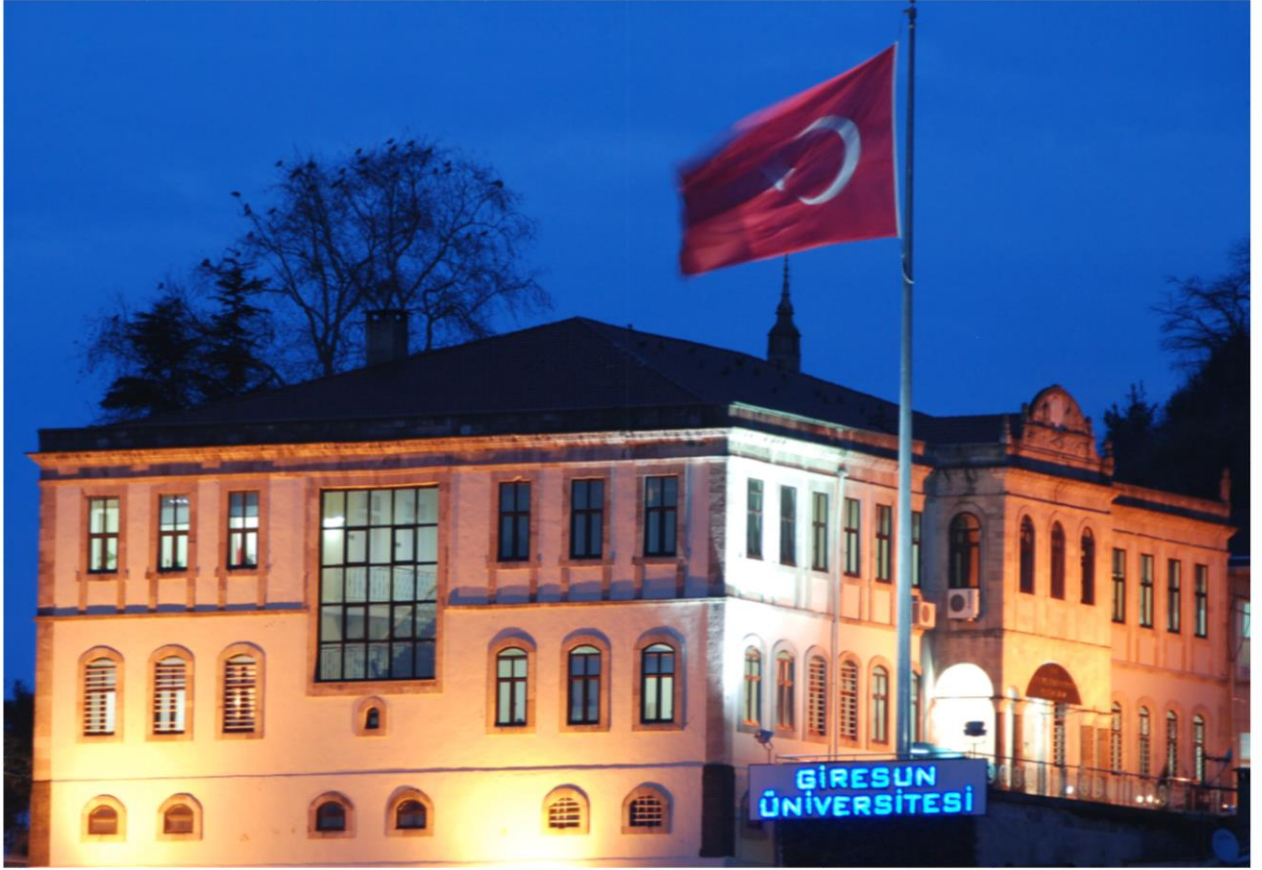
Giresun Üniversitesi Merkez Rektörlük Binası