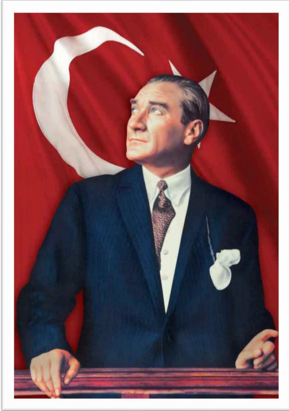
Gazi Mustafa Kemal ATATÜRK