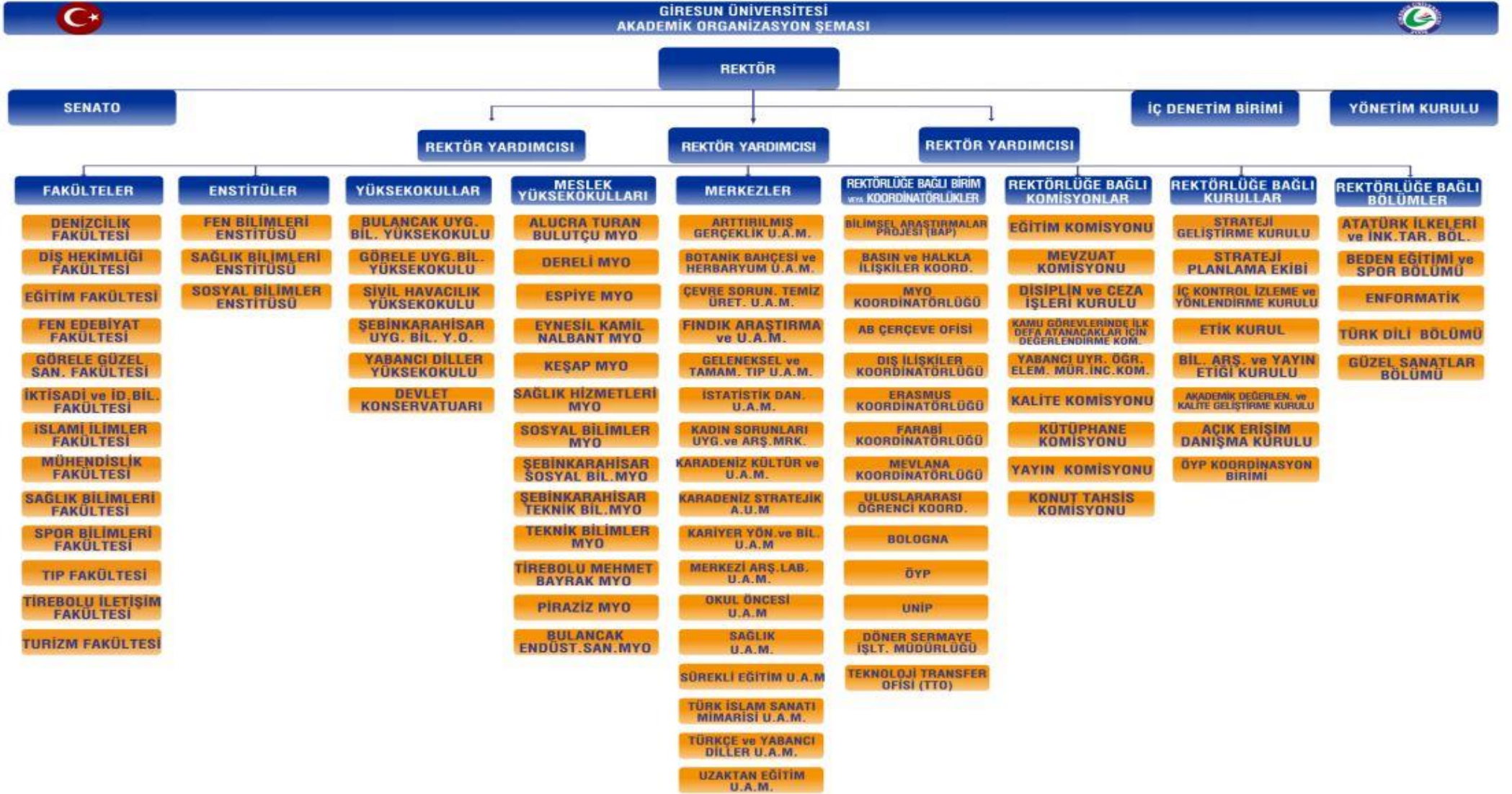
Şekil 2: Organizasyon Şeması