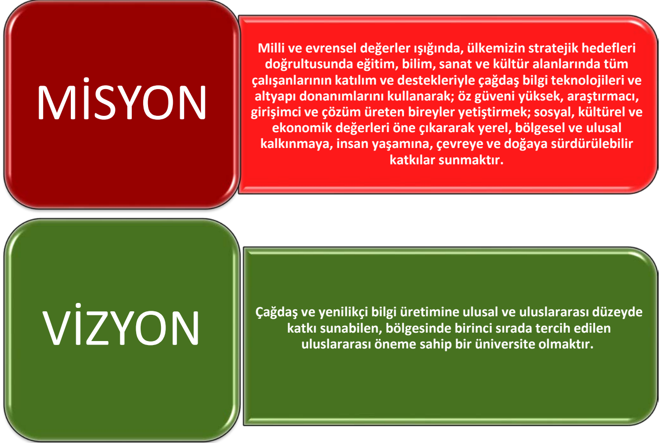
Şekil 1: Mision-Vizyon Grafiği