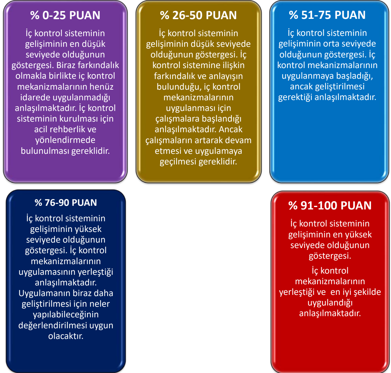
Şekil 4: İç Kontrol Sistemi Soru Formu Sonuçlarının Yorumlanması Grafiği