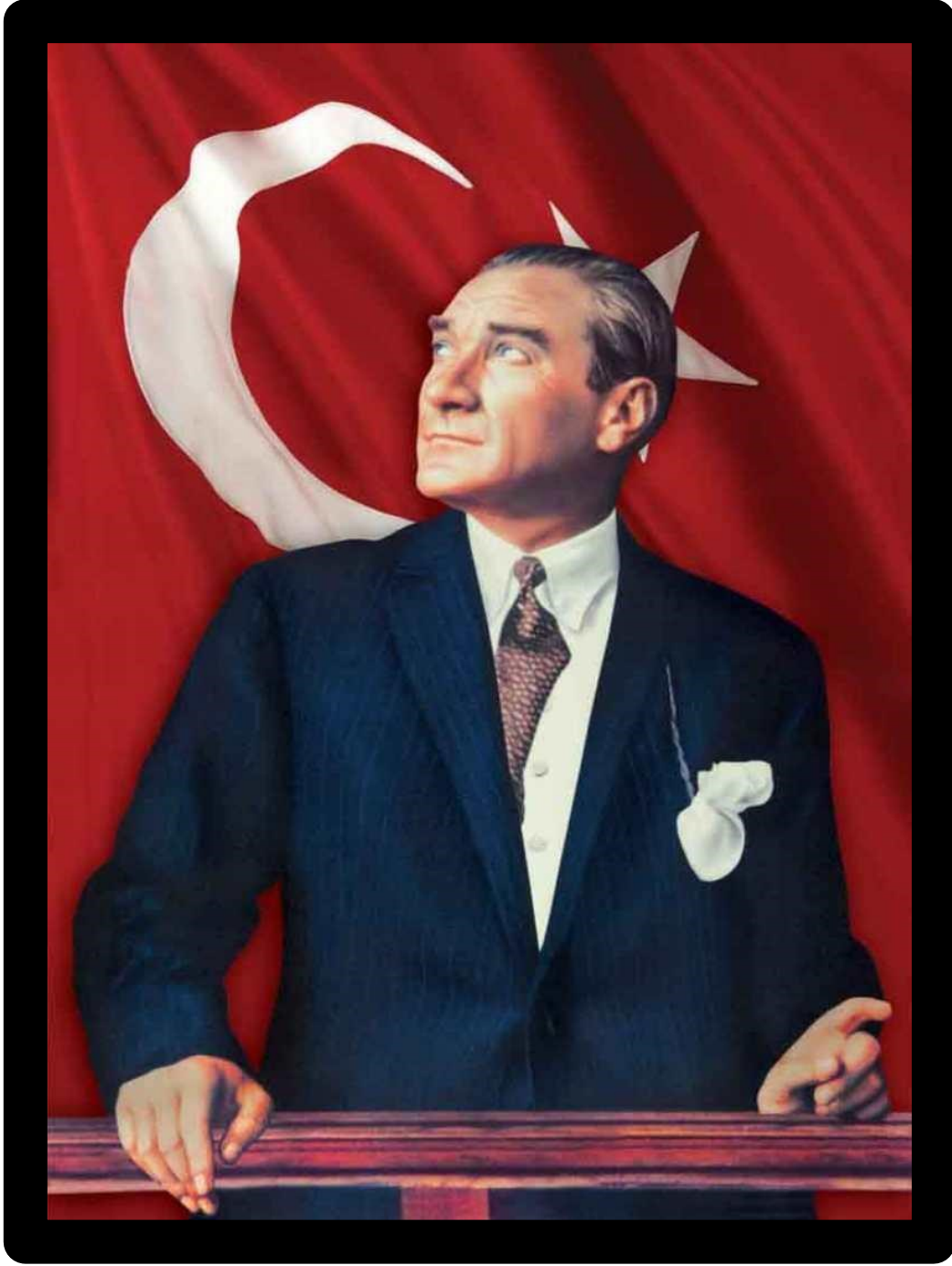
GAZİ MUSTAFA KEMAL ATATÜRK