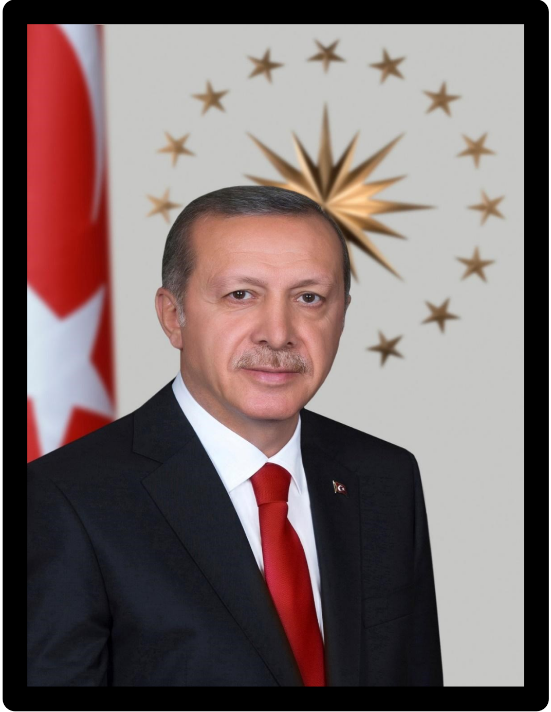
RECEP TAYYİP ERDOĞAN CUMHURBAŞKANI