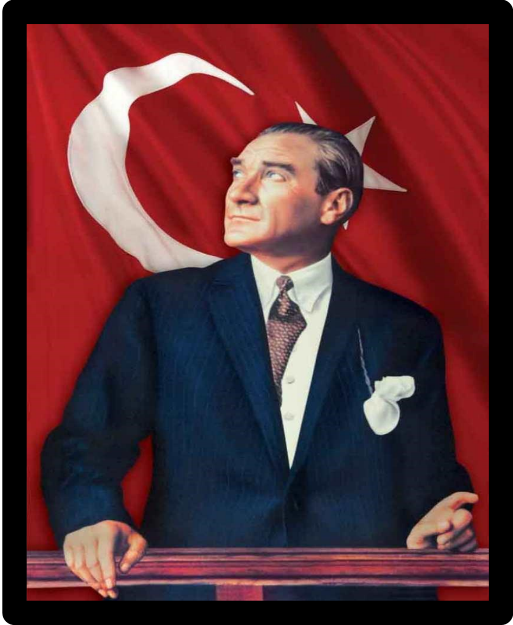
GAZİ MUSTAFA KEMAL ATATÜRK