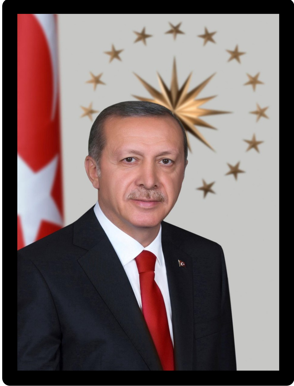
RECEP TAYYİP ERDOĞAN CUMHURBAŞKANI